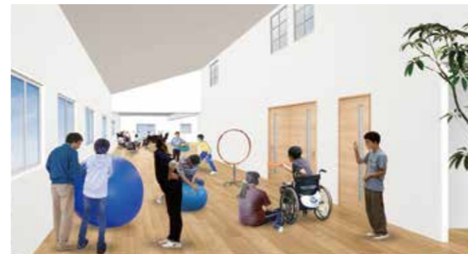
▲ブレイルームイメージパース