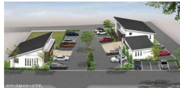
※パースはイメージです。