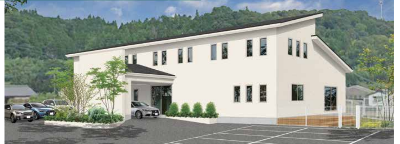
※パースはイメージ