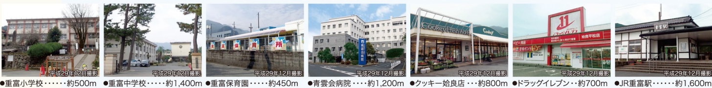
●重富小学校・・・約500m ●重富中学校・・・約1,400m ●重富保育園・・・約450m ●青雲会病院・・・約1,200m ●クッキー始良店・・・約800m ●ドラッグイレブン・・・約700m ●JR重富駅・・・約1,600m