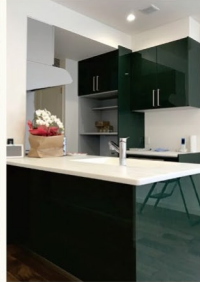
▲グリーンが印象的なキッチン