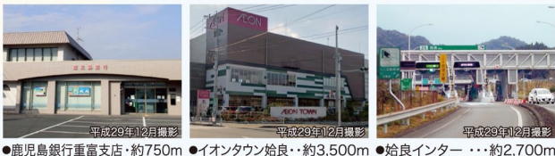
●鹿児島銀行重富支店・・・約750m ●イオンタウン始良・・・約3,500m ●始良インター・・・約2,700m

【物件概要】●名称/サザンヒルズ重富●所在地/鹿児島県始良市平松4837番1外18筆●交通/JR「重富」駅より徒歩20分●開発総面積/9,776.60㎡●開発許可番号/指令建第29-26号●総区画数/35区画●今回販売区画数/21区画●地目/宅地●用途地域/第1種低層住居専用地域●都市計画/非線引き区域●建ぺい率/50%または60%●容積率/80%●区画面積/181.82㎡(12号地・13号地)~258.94㎡(20号地)●販売価格/742.5万円(12号地・13号地)~1,066.40万円(31号地)●最多販売価格帯/800万円台(19区画)●私道負担/無●土地の権利形態/所有権●道路/6m公道●学校/重富小学校(約500m)、重富中学校(約1400m)●工事完了予定年月/平成30年6月●設備の整備状況/電気:九州電力(他の小売電気事業者の選択も可)、ガス:個別プロパン、飲用水:公営上水道、汚水:個別浄化槽●取引態様:売主(2号地、5号地)、販売代理(2号地、5号地を除く区画)●事業主・売主(一部区画)/株式会社ウエダ開発 日置市伊集院町大田7番地TEL099-273-6022 宅地建物取引業免許 鹿児島県知事許可(4)第5142号、(公社)鹿児島県宅地建物取引業協会会員●広告作成日/平成30年4月27日●広告表示の有効期限/平成30年7月31日