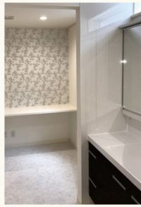
▲洗面室から家事スペース