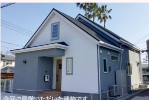
今回ご見学いただいた建物です