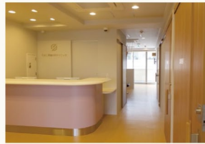
▲受付から検査待合

三井ホームの医院開業支援システム「ドクタープラン」により、診療圏調査から始まり設計施工までお手伝いさせていただいているクリニックの建築現場をご覧いただける見学会です。医院の建築をお考えの先生方には、設計上の様々な工夫や最新設備、デザインのトレンドをご覧いただける絶好のチャンスです。