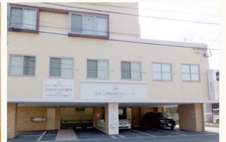
▲1F駐車場 2Fクリニック