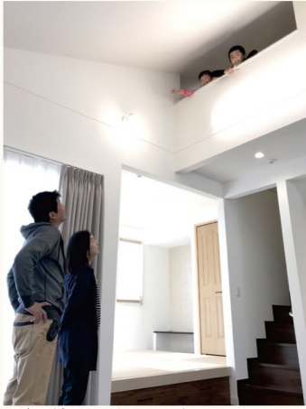
▲リビング内スロープシーリング