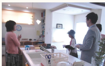
▲5月に開催したお住まい見学会の様子

鹿児島市永吉1丁目の閑静な住宅街にピンクのふかし窓が印象的なお住まいが完成しました。当初はご実家のリフォームをお考えで住宅展示場に来場されたそうですが、せっかくなら自分たちが住みやすく、子育てしやすい家を作りたいと思い建替えをすることになりました。営業担当・設計士・インテリアコーディネーターと何度も打合せを重ねていくことで良好な関係を築くことができ、以前住んでいた家の不満や要望などの細かいところまでくみとってもらえて最終的に自分たちのベストな家ができた大変満足していらっしゃいました。