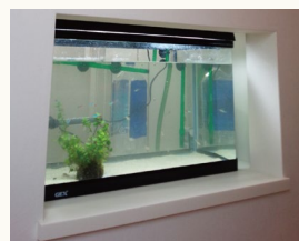
▲趣味のアクアリウム

奥様のこだわりでキッチンリビングの中央に置くことにより、作業をしながらでも家族全員の顔を見渡すことができる家族団らの空間になりました。リビング部分が吹き抜けになっているのも2階にいる子どもたちの様子がいつでもわかるようにとのこと。また「以前の住まいは鉄筋コンクリート造の住まいで冬はとて寒く、光熱費もかなり高かったのですが、三井ホームの住まいと健康空調システムのおかげで家中とても快適で光熱費も抑えられて助かってます」とおっしゃっていました。5月にはお住まい見学会にもご協力頂き、多くのお客様に、三井ホームの住まいの良さをご体感頂きました。