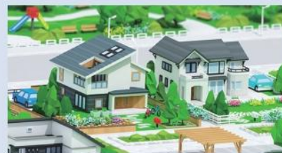
MITSUI HOME WORLD バーチャルモデルハウスタウン