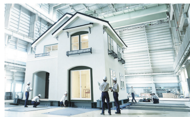
震度7連続60回の過酷な耐震実験にも耐えたモデルハウス