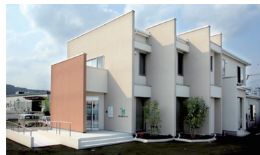
鹿児島県霧島市「隼人の柱クリニック」