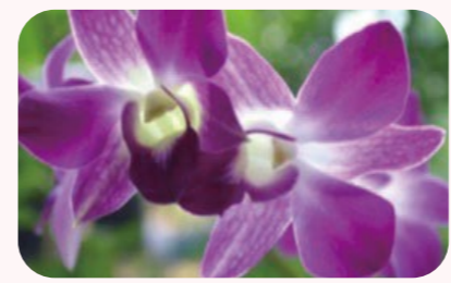
6月ワークショップのメインのお花 「デンファレ」

2022年6月11日(土)開催 マンスリー花セラピー6月ワークショップ 迷いと楽しく向き合うヒントを お花から学びましょう お花と心理学との融合から生まれた花セラピー