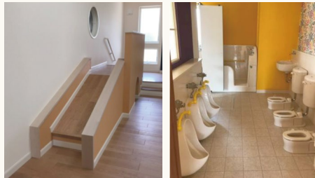
▲ゆうぎ室のすべり台

「女性の活躍推進」や「仕事・子育て両立」を支える職場環境づくりの一環として、従業員のための保育園を構想中の方、「企業主導型保育事業」について興味がある方、また、検討中の企業・法人様はぜひこの機会にご来場ください!