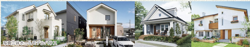
写真三井ホームモデルハウス

■所在地：鹿児島市桜ヶ丘1丁目35-12 ■交通：市営バス「桜ヶ丘2丁目」バスより徒歩3分 ■販売区画数：1区画 ■地目：宅地 ■用途地域：第1種低層住居専用地域 ■都市計画：市街化区域 ■建ぺい率：60% ■容積率：80% ■私道負担なし ■土地の権利形態：所有権 ■道路：南側幅員6m・東側公道幅員4m、アスファルト舗装 ■その他法令上の制限：建築基準法第22条指定地域 ■学校：桜ヶ丘西小学校(約650m)、桜ヶ丘中学校(約800m) ■設備概要：電気(九州電力)、都市ガス(日本ガス)、上水道(公営；給水負担金別途)、下水道(公営；下水道受益者負担金20,200円/150mm)・汚水・雑排水：側溝 ■取引形態：売主 ■広告作成日：2019年4月9日 ■広告表示の有効期限：2019年6月30日