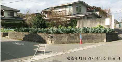
撮影年月日 2019年 3月 8日