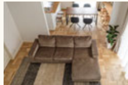
▲床はパーケットフロアでナチュラルに