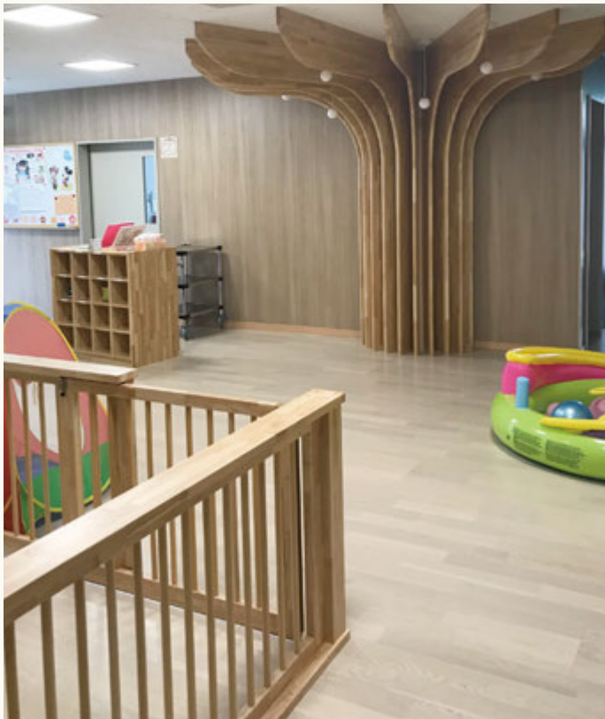
▲玄関ホール エントランス

安全を考慮したリフォーム技術はもちろん、三井ホームならではの高いインテリア性も自信を持ってご紹介できるポイントです。優しさと温かみの感じられる色合いや素材感で、園児たちが快適に楽しく過ごせる空間に生まれ変わりました。