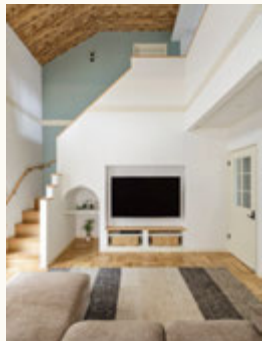
▲階段と一体の開放感ある吹き抜け