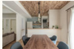
▲床と色調を合わせた木目調の天井