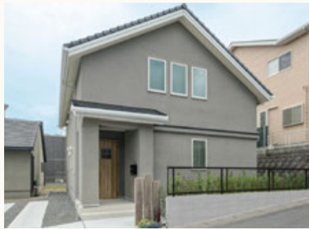
▲地震や台風などの外力も均等に受け止める安定感のある箱型の外観