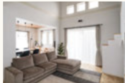
▲自然光が差し込む吹き抜けの高窓